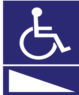
경사로표지판 벽부착형(400x540) 스탠드형(400X540X1500)